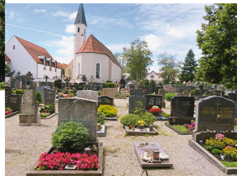
Der Stadtfriedhof in Schongau: Blick auf mehrere Gräberreihen.

Das Bürgerauskunftssystem kommt bei allen Schongauern gut an. An den Eingängen der Friedhöfe finden sich QR-Codes, über die Besucher nach Gräbern