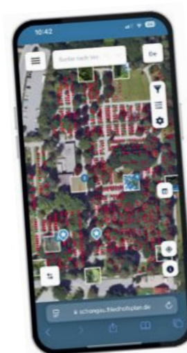
Auch auf dem Mobiltelefon kann der digitale Friedhofsplan abgerufen werden.

queme Suche nach Gräbern digital anbieten, sondern sie können vorab auch Gräber digital aussuchen und reservieren. Unsere gesamte Arbeitsweise in der Verwaltung wurde zudem sehr stark erleichtert. Wir legen im PC die Arbeitsaufträ-