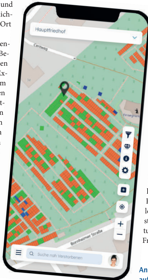
Ansicht eines Friedhofsplans auf einem Smartphone.

Darüber hinaus besteht die Möglichkeit, die Online-Reservierung auch für den Bürger freizuschalten. Dort kann dann der Bürger oder die Hinterbliebenen selbst die Online-Reservierung vornehmen. Auch in diesem Fall kann die Friedhofsverwaltung definieren welche Gräber in der Online-Reservierung oder Online-Grabvermarktung angeboten werden. In Zeiten der zunehmenden Digitalisierung wird sich daraus ein Vermarktungsvorteil gegenüber anderen Friedhofsverwaltungen erge- ▶