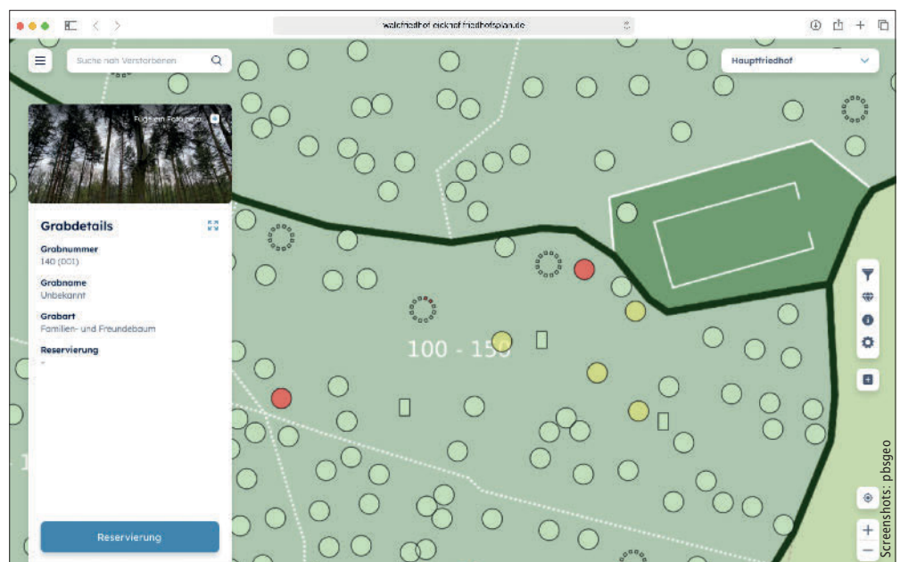
Screenshot mit der Übersicht eines Waldfriedhofes.