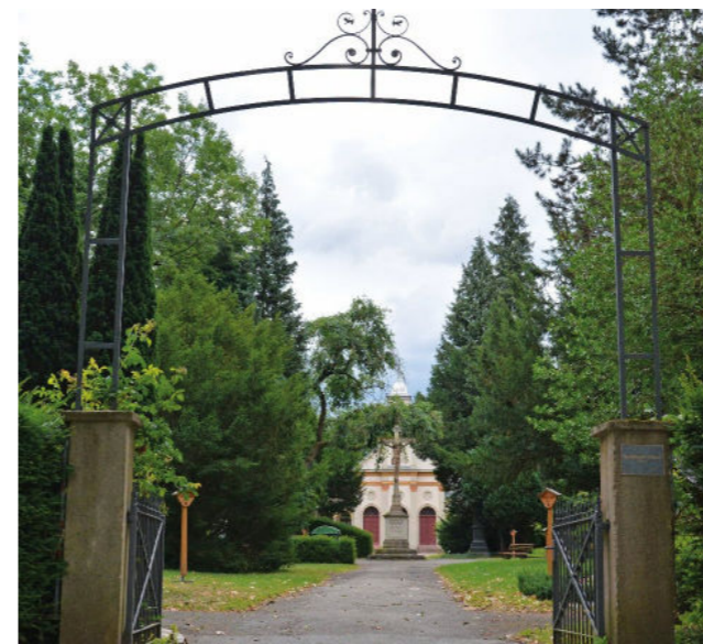
Eingangsbereich des Waldbachfriedhofs.

Um die Verwendung des digitalen Friedhofsplans vor Ort zu erleichtern, werden demnächst Schilder mit QR-Code den Papierplan im Schaukasten, von dem der QR-Code bislang abfotografiert werden musste, ablösen. Geplant ist darüber hinaus auch die Zusammenarbeit mit dem Historischen Förderverein in Offenburg, um den Bürgern