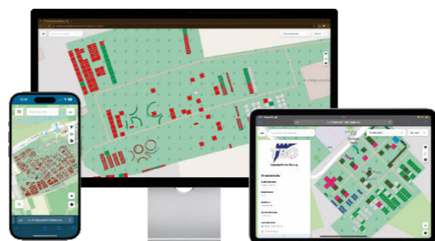
Die Friedhofspläne lassen sich auf allen Endgeräten aufrufen.

ausgewählten Friedhof begraben liegen. Durch die Auswahl eines Namens aus der Liste wird die Grabstelle auf dem Übersichtsplan angezeigt“, erklärt Jäger die Vorgehensweise.