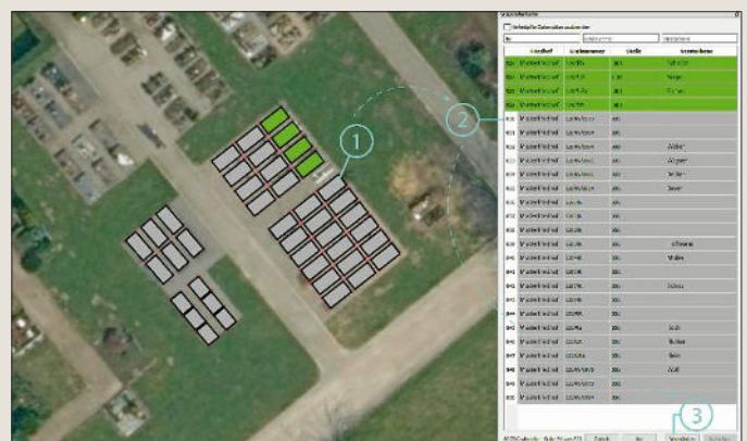
Abbildung 2: Verknüpfen der Grabgeometrien